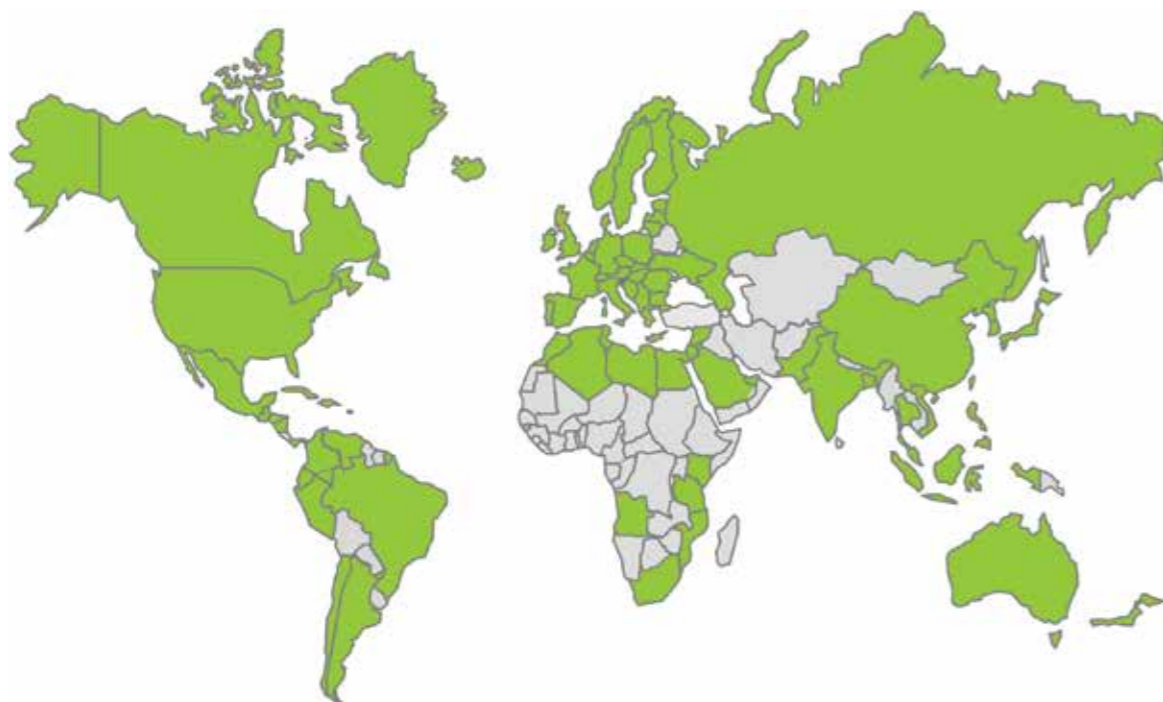
Mappa indicative dei Paesi dotati di LMR o di Import Tolerance per Boscalid (Aggiornamento dicembre 2015)

Mappa dei Paesi in cui è possibile esportare vini prodotti con uve protette con Cantus