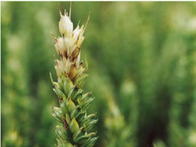
Spiga affetta da Fusariosi

COMET® PRO PACK è il fungicida da applicare in fase di spigatura e fioritura per prevenire e controllare le principali malattie dei cereali. COMET® PRO PACK assicura una notevole riduzione delle micotossine (DON) e una maggiore conservabilità della granella, aumentando così il valore del raccolto.