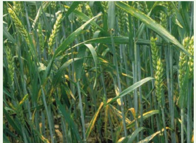
Foglie affette da Septoriosi