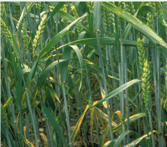
Frumento affetto da septoriosi

L'effetto AgCelence ® è un concetto che va oltre lo standard della tradizionale protezione delle colture, rendendole più tolleranti allo stress e più efficienti nello sviluppo.