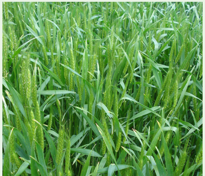
Trattato con Comet ® 250 EC